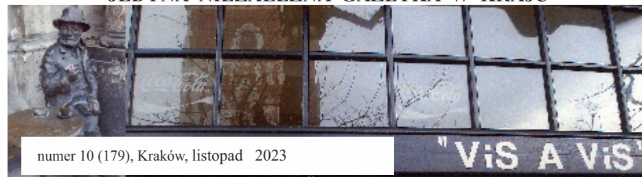
numer 10 (179), Kraków, listopad 2023