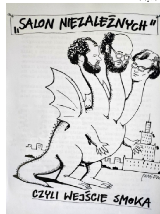
rys: A. Mleczko

Napisy ryl Grabarz z Krakowa. Milego dzionka! (cdn.)